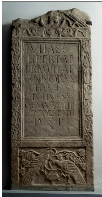
Stela Julije Primile (2. pol. 1. st.), Muzej Slavonije, Osijek