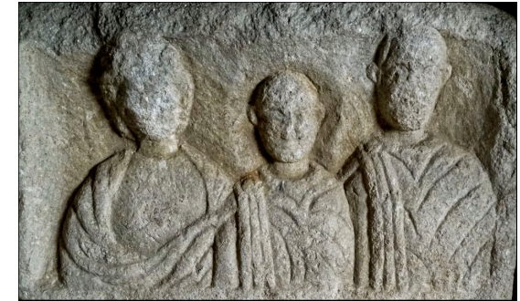
Portretna stela Aurelija Januarija (2.-3. st.), Arheološki muzej u Zagrebu

istovjetnim podacima za druge rimske provincije. Ukazuje se na metodološke prednosti i ograničenja proučavanja rimske društvene i obiteljske povijesti na temelju natpisa.